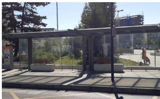
Dans l'axe de vol : abribus av. Bel Air