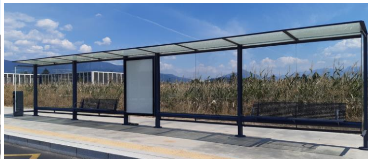
Belle-terre Thônex, entre 2 champs de maïs